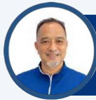
MASRI SALES MANAGER