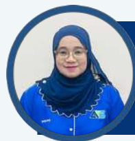
ROHANA CO FOUNDER